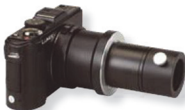
Цифровая камера с соединителем для микроскопа