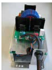
Цифровой генератор плазмы обеспечивает оптимизацию искрового возбуждения