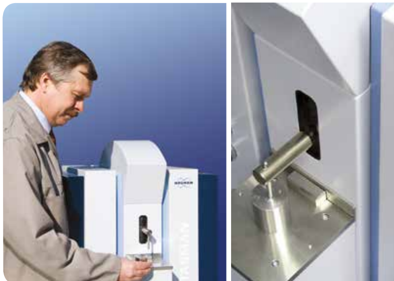
Настраиваемый автоматический пневматический прижим обеспечивает простоту установки и смены образцов

Система регистрации контролируется микропроцессором и математически адаптирована под характеристики новейших CCD-детекторов.